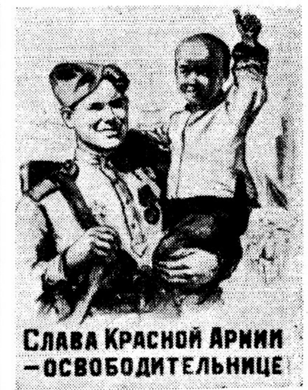
Слава Красной Армии — освободительнице